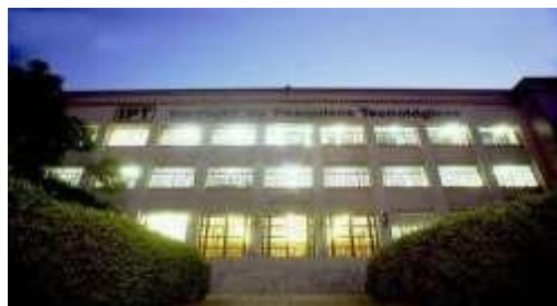
Fotografia 1 – Fachada do prédio Adriano Marchini